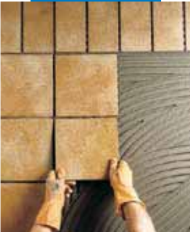
Posa di klinker all'esterno