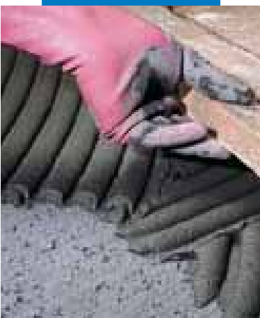
Posa di cotto fatto a mano su massetto sconnesso