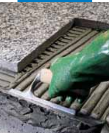
Posa di marmette con graniglie, in rilievo all'esterno