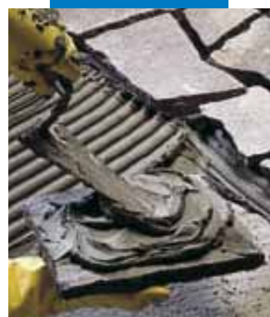
Posa di pietra a spacco in esterno con o senza imbruttatura secondo lo spessore