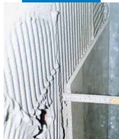
Posa a spessore di grès porcellanato a parete